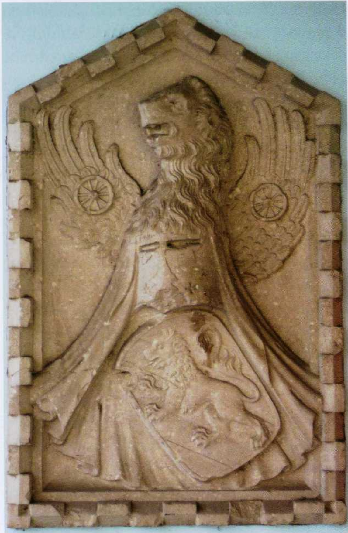
Sambruson. Scuole elementari. Blasone dei Badoer da Peraga. Scudetto con leone rampante a sinistra, sormontato da cimiero con