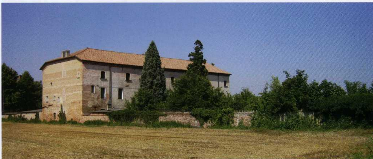
Altare di Sambruson. Edificio monastico già di proprietà dei monaci di San Giorgio in Alga, acquistato nel secolo XVII dalle monache benedettine del monastero di Santa Giustina di Venezia ed attualmente utilizzato come casa di accoglienza, nella particella n. 12 del Catastico della Sesta presa. Dolo, Altare di Sambruson (ed. CONSORZIO DI BONIFICA BACCHIGLIONE BRENTA), e in due recenti immagini dell'esterno e del portico interno a piano terra.