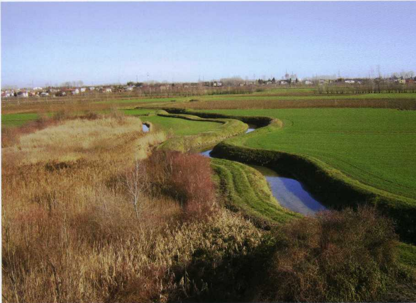
Sambruson. Il corso attuale dell'antica "pubblica" o scolo Brenton, contrassegnato da numerose anse, all'ingresso nel territorio Stra-Paluello.